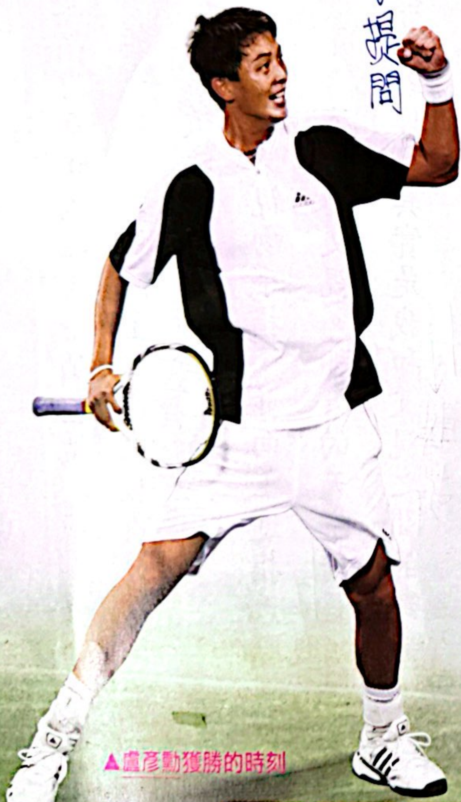
▲盧彥勳獲勝的時刻