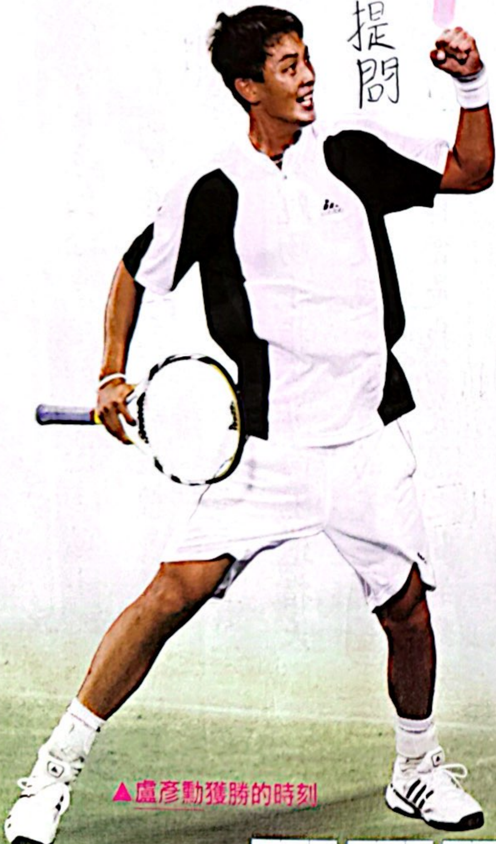
▲盧彥勳獲勝的時刻